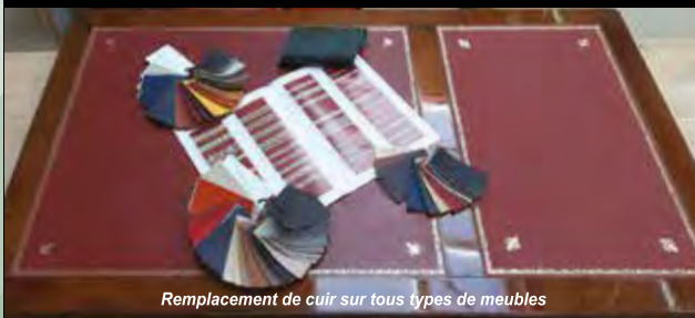
Remplacement de cuir sur tous types de meubles

Agencement cuisine, dressing ... Parquet, terrasse ... Restauration de meubles - Menuiserie intérieure & extérieure