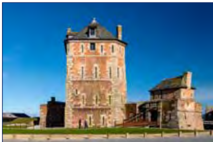
La tour Vauban

Chaque visiteur se voit remettre avec son billet d'entrée une tablette de visite qui le guidera au fil de la découverte du site. La présence d'une table multimédia adaptée au sein de notre accueil-boutique permet également aux personnes à mobilité réduite d'accéder à une visite virtuelle du site.