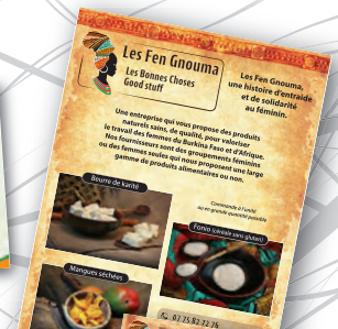
Logotype, flyers et cartes commerciales