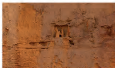
Comme les vestiges d'une autre civilisation, le vent et l'eau ont sculpté la matière.