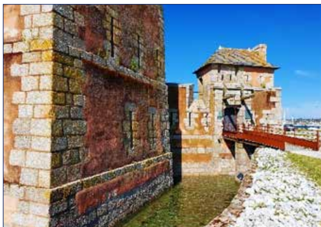
La tour Vauban

Venez découvrir ou redécouvrir ce site d'exception appartenant au Réseau des sites majeurs de Vauban inscrit au patrimoine mondial de l'UNESCO.