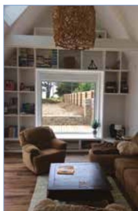
Rénovation et extension d'une maison à Crozon

tél. : 06 08 57 61 54 mail : gazin.bruno@orange.fr www.gazin-architecte-interieur.fr